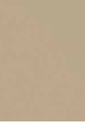
بيج فاتح (HAG) Nuance Beige